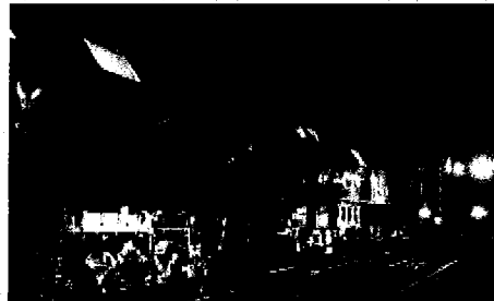
Renouvellement de rails à l'aide du train BOA